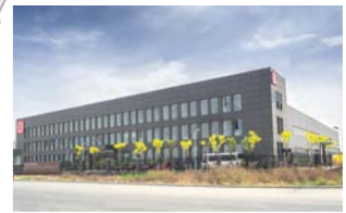
RINGSPANN Power Transmission (Tianjin) Co., Ltd., 中国