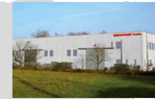
RINGSPANN Italia S.r.l., 意大利