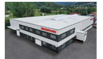
RINGSPANN Bosanska Krupa d.o.o., 波黑共和国