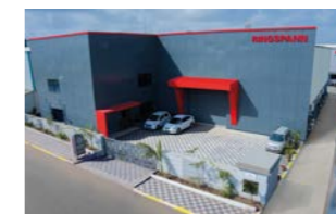
RINGSPANN Power Transmission India Pvt. Ltd., 印度