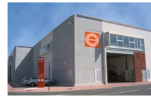
RINGSPANN IBERICA S.A., 西班牙