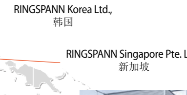
RINGSPANN Singapore Pte. Ltd., 新加坡