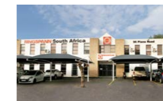
RINGSPANN South Africa (Pty) Ltd., 南非