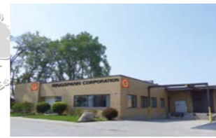
RINGSPANN CORPORATION, 美国