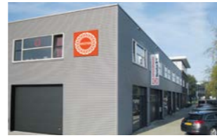
RINGSPANN Benelux B.V., 荷兰