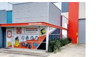
RINGSPANN Australia Pty Ltd, 澳大利亚