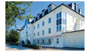
RINGSPANN Nordic AB, 瑞典