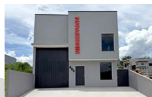
RINGSPANN do Brasil Ltda., 巴西