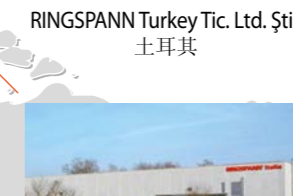
RINGSPANN Turkey Tic. Ltd. Şti., 土耳其