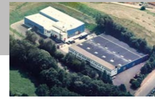
RINGSPANN Kempf GmbH, 德国 万向轴制造基地