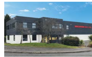
RINGSPANN (U.K.) LTD., 英国