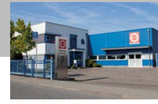
RINGSPANN RCS GmbH, 德国 远程控制系统工厂