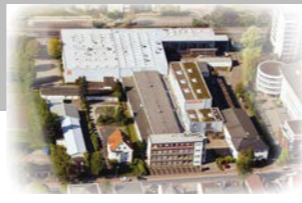
RINGSPANN GmbH, 德国 总部, 离合器制造基地